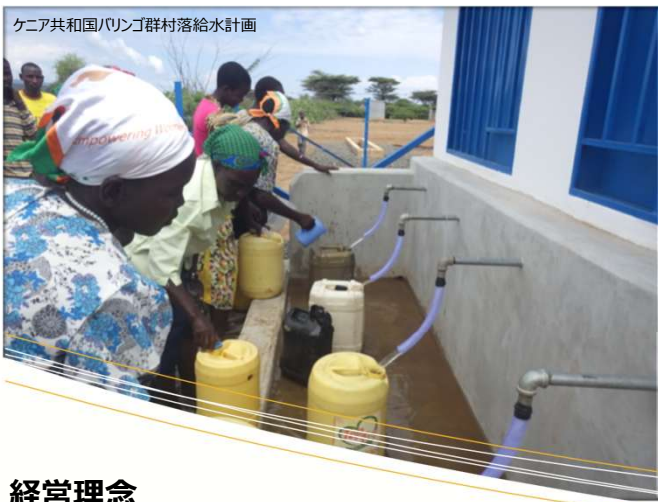
ケニア共和国ハリコ群村落給水計画