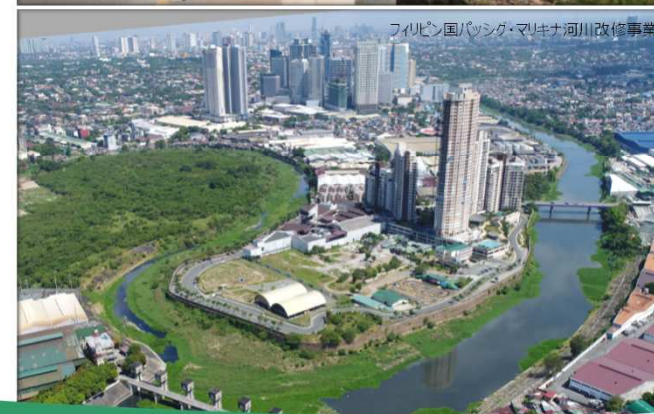
フィリピン国パシグ・マリキナ河川改修事業