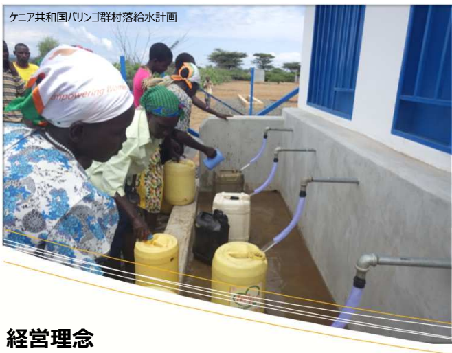
ケニア共和国バリンゴ郡村落給水計画