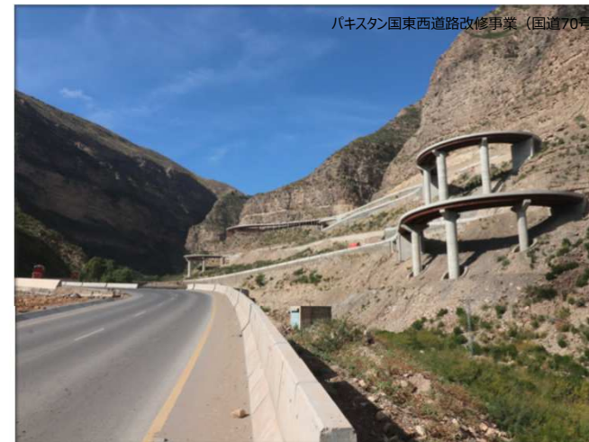
パキスタン国東西道路改修事業（国道70号）